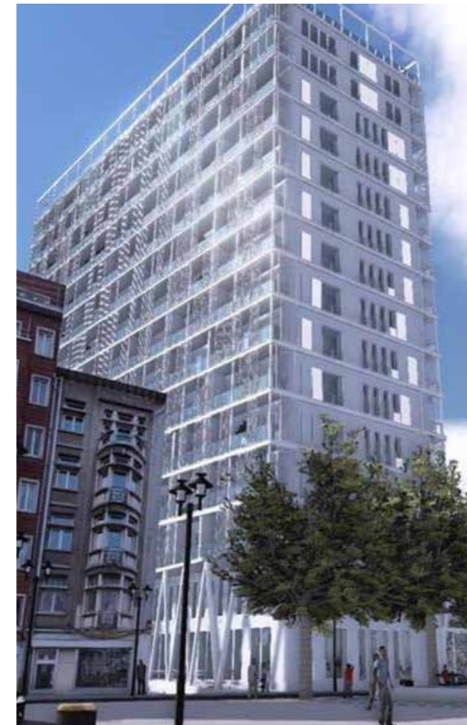
COSMOPOLITAN TOWER BRUSSEL