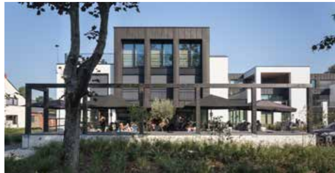
HET NOTARIAAT NIJLEN