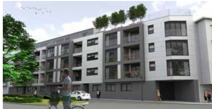
RESIDENTIE KLEIN-NORMANDIË KRAAINEM