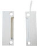
FE01076 CONTACTO MAGNETICO MC740 G2