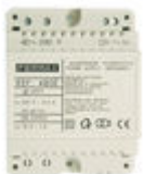
F04802 ALIMENTADOR DIN4 230VAC/12VAC-1A