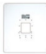
F03389 PLAQUE DE PROPRETÉ UNIVERSELLE GRANDE