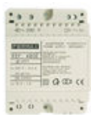
F04802 ALIMENTATION DIN4 230VAC/12VAC-1A