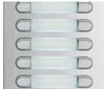
F04844 PLATINE AUDIO KIT CITY 4+N 24/BP