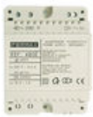
F04802 ALIMENTATION DIN4 230VAC/12VAC-1A