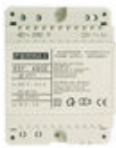
F04802 ALIMENTADOR DIN4 230VAC/12VAC-1A