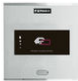
F06992 LECTOR PROXIMIDAD CITY