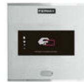
F06992 LECTEUR PROXIMITÉ CITY