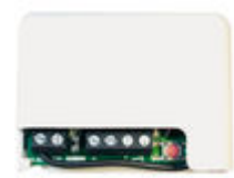
F05291 RECEPTOR RF BASIC-MINI 12-24V