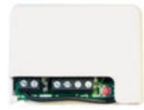
F05291 RECEPTOR RF BASIC-MINI 12-24V