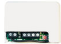
F05291 RECEPTOR RF BASIC-MINI 12-24V