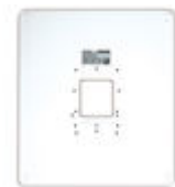
F03389 TAMPA DECORATIVA UNIVERSAL LARGE