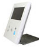
F09420 SUPORTE DE MESA MONITOR VEO- XS/VEO-XL