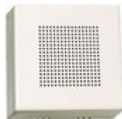
F02040 PROLONGADOR DE CHAMADA