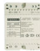
F04802 ALIMENTADOR DIN4 230VAC/12VAC-1A