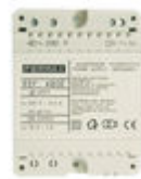
F04802 ALIMENTADOR DIN4 230VAC/12VAC-1A