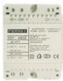
F04802 ALIMENTADOR DIN4 230VAC/12VAC-1A