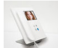
F09410 SOPORTE SOBREMESA MONITOR VEO