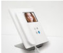
F09410 SOPORTE SOBREMESA MONITOR VEO