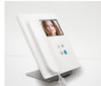
F09410 SOPORTE SOBREMESA MONITOR VEO