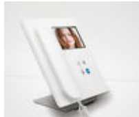
F09410 SOPORTE SOBREMESA MONITOR VEO