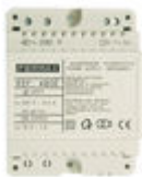
F04802 ALIMENTADOR DIN4 230VAC/12VAC-1A