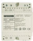
F04802 ALIMENTATION DIN4 230VAC/12VAC-1A