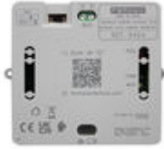
ACTIVADOR LUCES-TIMBRE VDS