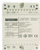
F04802 ALIMENTATION DIN4 230VAC/12VAC-1A