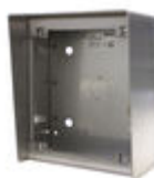
F04645 BOÎTIER EN SAILLIE MARINE ST1