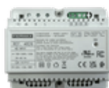
F04826 ALIMENTATION+FILTRE DIN6 24VDC-1.5A