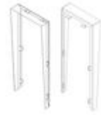
F04701 VISIÈRE MARINE ST1