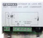
F02438 ACTIVATEUR SONNETTE OU ECLAIRAGE VDS