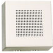
F02040 PROLONGATEUR APPEL ÉLECTRONIQ.