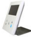
F09420 SUPPORT BUREAU MONITEUR VEO- XS/VEO-XL