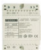
F04802 ALIMENTADOR DIN4 230VAC/12VAC-1A