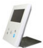
F09420 SOPORTE SOBREMESA MONITOR VEO-