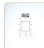
F03389 MARCO UNIVERSAL LARGE