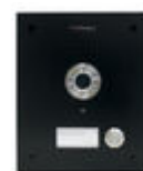
F44438 PLACA MARINE NEGRO ST1 CP101 DUOX PLUS