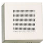
F02040 PROLONGADOR LLAMADA TELEFONO