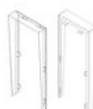
F04701 VISERA MARINE ST1