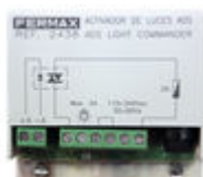
F02438 ACTIVADOR LUCES-TIMBRE VDS