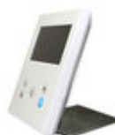
F09420 SOPORTE SOBREMESA MONITOR VEO- XS/VEO-XL