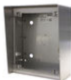
F04645 CAJA SUPERFICIE MARINE ST1