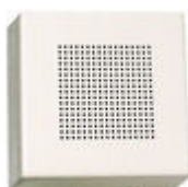
F02040 PROLONGADOR LLAMADA TELEFONO