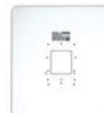
F03389 MARCO UNIVERSAL LARGE