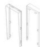
F04701 VISERA MARINE ST1