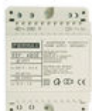
F04802 ALIMENTADOR DIN4 230VAC/12VAC-1A