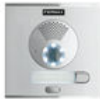
F40708 PLATINE CITY S1 CP101 DUOX PLUS