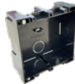
F08948 CAJA EMPOTRAR CITY KIT S1