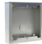
F07061 CAJA SUPERFICIE CITY S1