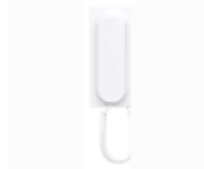
F03443 BRAZO VEO CON BUCLE INDUCTIVO