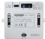
F09444 INTERFAZ CAMARA DUOX PLUS