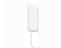
F03443 BRAÇO VEO C/ BOBINA INDUTIVA