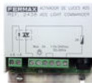
F02438 ACTIVADOR CAMPAINHA/LUZES