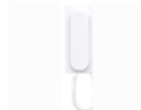
F03443 BRAÇO VEO C/ BOBINA INDUTIVA