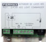
F02438 ACTIVADOR CAMPAINHA/LUZES