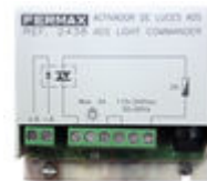
F02438 ACTIVADOR CAMPAINHA/LUZES