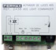
F02438 ACTIVADOR CAMPAINHA/LUZES