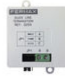
F03255 ADAPTADOR DE LINHA DUOX