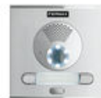
F40008 BOTONEIRA CITY S1 CP201 DUOX PLUS