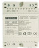
F04802 ALIMENTADOR DIN 4 12Vac/1A