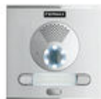
F40008 BOTONEIRA CITY S1 CP201 DUOX PLUS