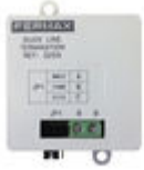
F03255 ADAPTADOR DE LINHA DUOX