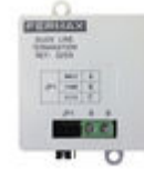
F03255 ADAPTADOR DE LINHA DUOX