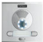
F40008 BOTONEIRA CITY S1 CP201 DUOX PLUS