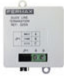
F03255 ADAPTADOR DE LINHA DUOX