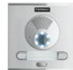
F40008 BOTONEIRA CITY S1 CP201 DUOX PLUS