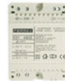
F04802 ALIMENTADOR DIN 4 12Vac/1A