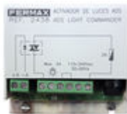
F02438 ACTIVATEUR SONNETTE OU ECLAIRAGE VDS