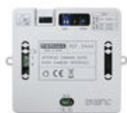
F09444 INTERFACE CAMÉRA DUOX PLUS