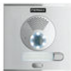
F40708 PLATINE CITY S1 CP101 DUOX PLUS