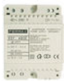
F04802 ALIMENTATION DIN4 230VAC/12VAC-1A