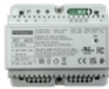
F04826 ALIMENTATION+FILTRE DIN6 24VDC-1.5A