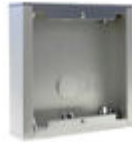
F07061 CAJA SUPERFICIE CITY S1