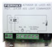
F02438 ACTIVADOR LUCES-TIMBRE VDS