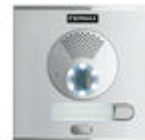
F40708 PLACA CITY S1 CP101 DUOX PLUS