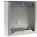
F07061 CAJA SUPERFICIE CITY S1