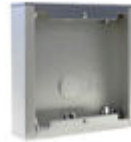
F07061 CAJA SUPERFICIE CITY S1