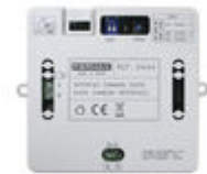
F09444 INTERFAZ CAMARA DUOX PLUS