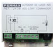
F02438 ACTIVADOR LUCES-TIMBRE VDS