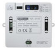
F09444 INTERFAZ CAMARA DUOX PLUS