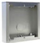
F07061 CAJA SUPERFICIE CITY S1