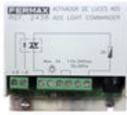
F02438 ACTIVADOR LUCES-TIMBRE VDS