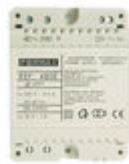
F04802 ALIMENTADOR DIN4 230VAC/12VAC-1A