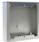
F07061 CAJA SUPERFICIE CITY S1