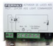
F02438 ACTIVADOR LUCES-TIMBRE VDS