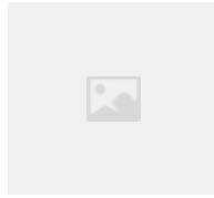
F01812 MECANISMO 540Ab MAX