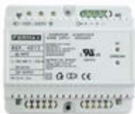
F04813 ALIMENTADOR DIN6 100-240VAC/12VDC-2A