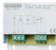
F02013 RELE FUNCIONES ADICIONALES