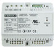
F04813 ALIMENTADOR DIN6 100-240VAC/12VDC-2A