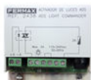
F02438 ACTIVATEUR SONNETTE OU ECLAIRAGE VDS