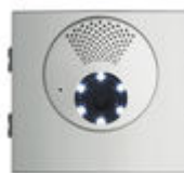
F73911 AMP. VID. DUOX PLUS SKYLINE W