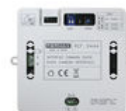
F09444 INTERFACE CAMÉRA DUOX PLUS