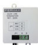
F03255 FIN LIGNE DUOX PLUS