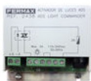
F02438 ACTIVATEUR SONNETTE OU ECLAIRAGE VDS