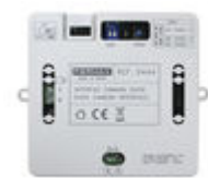
F09444 INTERFACE CAMÉRA DUOX PLUS