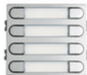
F07371 8 BP. 204 W VDS/BUS2 SKYLINE