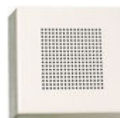
F02040 PROLONGATEUR APPEL ÉLECTRONIQ.