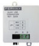
F03255 FIN LIGNE DUOX PLUS