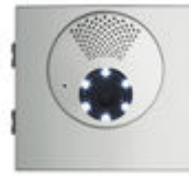
F73911 AMP. VID. DUOX PLUS SKYLINE W