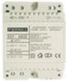
F04802 ALIMENTATION DIN4 230VAC/12VAC-1A