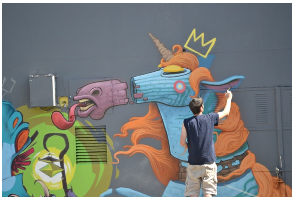
Detalle del muro de la Central de la Policía Local de Mislata (Valencia)

Además de los centenares de botes de espray y pintura, la jornada tuvo otros ingredientes estrechamente relacionados con la cultura urbana, como sesiones de dj's sin pausa, campeonato de skate y exhibiciones de tricking, ese deporte que combina artes marciales con gimnasia artística, giros y las patadas y volteretas típicas del breakdance.