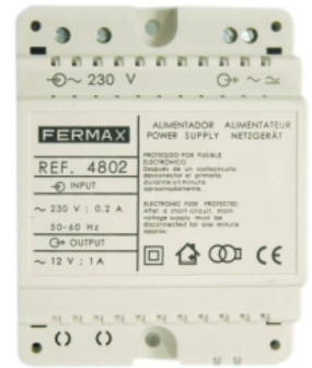
ALIMENTADOR DIN4 230VAC/12VAC-1A