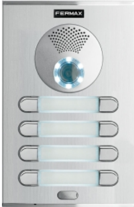
PLACA CITY S4 CP204 DUOX COLOR