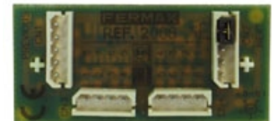
MODULO EXTENSION 8 LLAMADAS