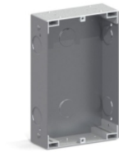
CAJA EMPOTRAR CITY KIT S4